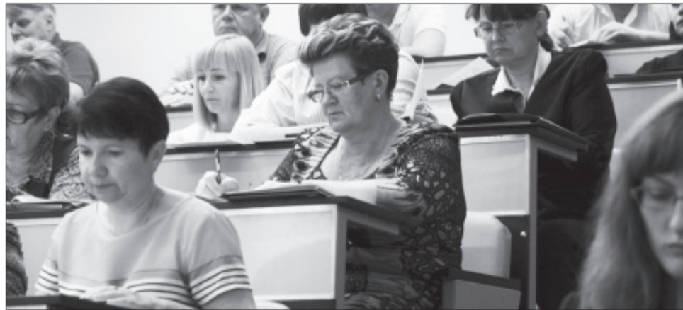
Слушатели программы повышения квалификации

Отметим, что участниками программы был прослушан ряд лекций, которые помогут реализовать практические вопросы реализации государственной политики в области энергосбережения и повышения энергетической эффективности на своих предприятиях. Так, они узнали об основных положениях этой