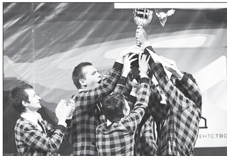
Кубок в руках волгоградской команды. Потом он появится в музее истории ВолГУ

Уже в 2010 ребята порадовали родную альма-матер потрясающему громкой и знаковой победой в турнире Открытой волгоградской лиги КВН. Но это только начало долгого и яркого пути. В этом же году в Сочи молодые люди стали обладателями высокого статуса «Повышенный рейтинг». Помимо того, что такое звание красиво звучит, оно дает право команде участвовать в крупных фестивалях и бороться за более высокие награды. После еще нескольких побед в подобных состязаниях кавээнщики объединились с командой другого университета (МФЮА) и отправились в Москву, «в гости к Маслякову». Теперь волгоградская