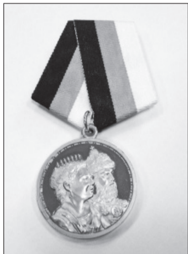
Медаль «В память 400-летия Дома Романовых. 1613–2013»

Медалью «В память 400-летия Дома Романовых. 1613–2013» награждаются лица, имеющие видные заслуги перед Россией и Российским императорским домом, внесшие значительный вклад в возрождение духовности, науки, культуры и образования, государственных и национальных традиций, в обеспечение обороноспособности Отечества, в развитие экономики, в благотворительную деятельность и помощь социально незащищенным и нуждающимся соотечественникам, в укрепление братских отношений между народами, в восстановление моральных и нравственных устоев общества, а также в подготовку празднования 400-летия окончания Смуты, возрождения российской государственности и всенародного при-