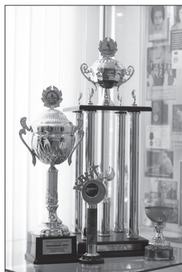
Кубки КВН в Музее истории ВолГУ

История нашей команды может смело рассеять миф о том, что, играя в КВН, невозможно попасть