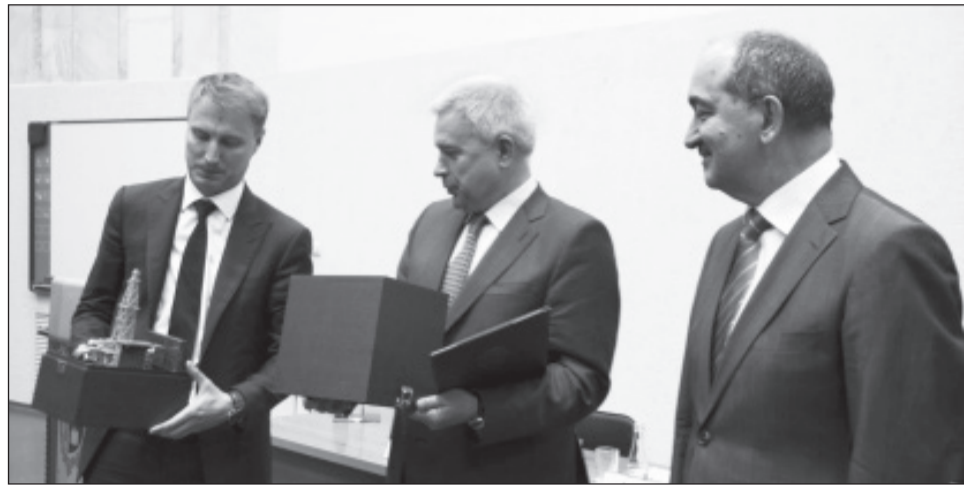
Музей истории ВолГУ пополнился новым экспонатом — макетом нефтяной вышки

В завершение своего выступления Вагит Юсуфович акцентировал внимание на том, что корпорации нужны выпускники, способные стать лучшими профессионалами, высказал слова надежды о том, что высшая школа, созданная сегодня в ВолГУ, поможет и в дальнейшем развивать потенциал компании, а отношения между